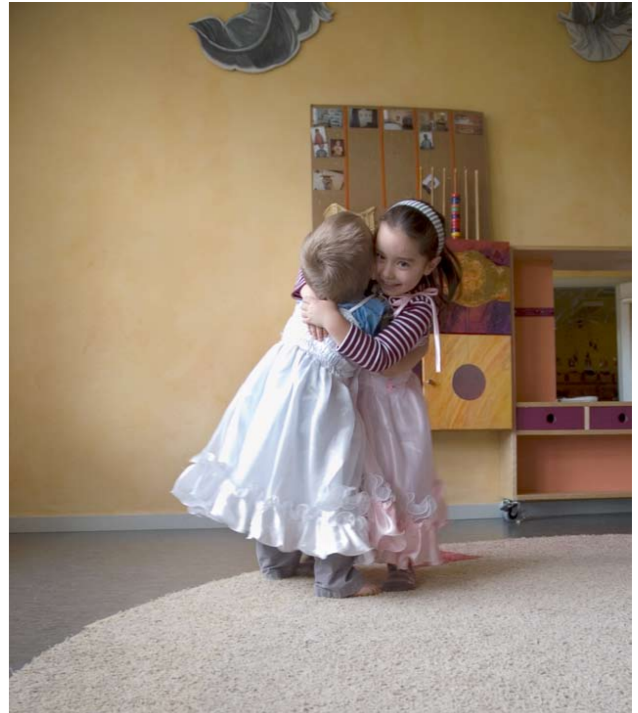
Snickaregårdens förskola, Kinna